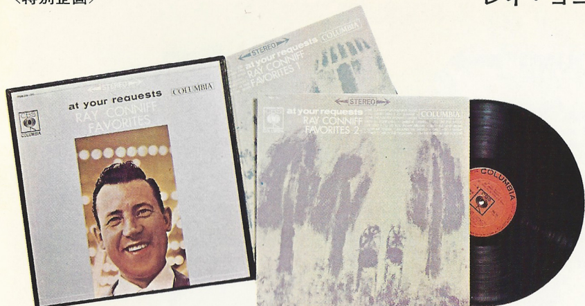
PSS-29~30 (2枚組) ¥3,000