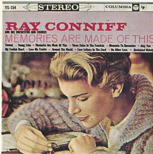
YS-154 (モノーラル SL-1040)