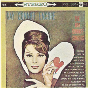
YS-161 (モノラル SL-1051)